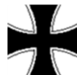
Soldaten- u. Veteranenverein Engishausen